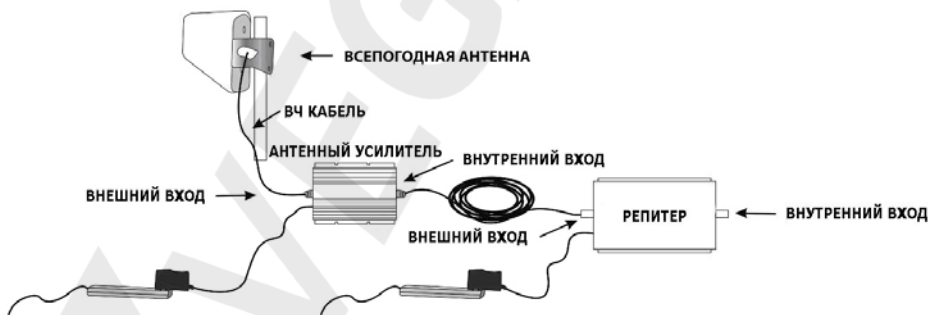
Схема подключения усилителя антенного

При использовании усилителя антенного необходимо принимать во внимание следующие моменты: